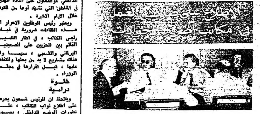
الرئيس كميل شعومون يجمع امس ، مع مدير مياه المهندس الياباني النجار ، ودرسا مشكلة توزيع مياه الشرب وازالة اسباب الشكوى حول هذا التوزيع .

كثت اوضاع وزارة الموارد موشع اهتمام الرئيس كميل شعومون امس ، على الصعيدين الاداري والتنظيمي ، وقد اجتمع مع مدير مياه المهندس الياباني النجار ، ودرسا مشكلة توزيع مياه الشرب وازالة اسباب الشكوى حول هذا التوزيع . ويجتمع الرئيس شعومون اليوم بكار موقفي الوزارة ، تابعة درس العمل في مشروع الليطاني ، استكمالا لاجتماع سابقة حول هذا الموضوع .